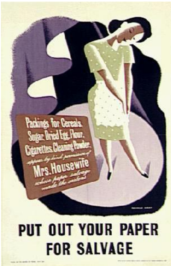
වම හා දකුණ : 129-130, අපතේ යැවීම සම්බන්ධව එරෙහි වන යුධ සමයේ පෝස්ටර්

මෙම නොකැමැත්ත තවත් වැඩිවන්නට හේතු වූයේ තමන් දැරූ තනතුරු වලින් ඔහු ලද ඒකාබද්ධ වැටුප ඔහුගේ ඉහළ නිලධාරීන්ගේ වැටුපට වඩා තරමක ඉහළ වීමය. (එන්. යූ. ජයවර්ධන, 11 මැයි 1987, p.3) එන්. යූ. සිය ජීවිතයේ උසස්වීම ලැබූයේ සිවිල් සේවා විභාගය සමත්වීමෙන් නොව පැහැදිලිව ඔප්පු කල හැකියාව මතයි. වෙනත් වෙනත් දෙපාර්තමේන්තු 4 ක ප්‍රධානියා ලෙස කටයුතු කිරීමෙන් ඔහු ඉපැයූ අදායම සිවිල් සේවයේ පළමුවන පන්තියේ, දෙවන ශ්‍රේණියේ නිලධාරියකුගේ වැටුපට සමාන විය. සිවිල් සේවයේ සාමාජිකයකු නොවූ එන්. යූ. ලැබූ මේ වරප්‍රසාදයට විරුද්ධව සිවිල් සේවා සංගමය විසින් දැඩි විරෝධතාවයක් දියත් කරනු ලැබිණ. එවකට සිටි වැඩ බලන මූල්‍ය ලේකම් සී ඊ. පෝන්ස් ද සමිබන්ඩ වූ එක්තරා සිද්ධියක් පිළිබඳව එන්. යූ. සිය වදනින්ම සටහන් තබා ඇත. මෙය වූ කලී සාම්ප්‍රදායික ඉහල පැලැන්තියේ සිවිල් සේවකයා විස්ථාපනය කරමින් විශේෂඥ තාක්ෂණඥයා සිහසුන හිමි කර ගැනීම විදහා දක්වන හොඳම සංසිද්ධියයි.