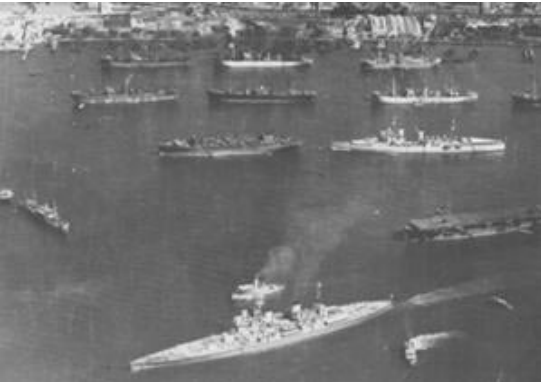
126. බ්‍රිතාන්‍ය යුධ නැව් කොළඹ වරායේ.

ඉදිරි ගමන නැවැත්වූ බව මෙනෙත් සිට ආපසු හැරී බලන විට අප දන්නා කරුණකි. නමුත් ජපන් හමුදාව ශ්‍රී ලංකාවට නැවත පහර දෙන්නට නොපැමිණෙනැයි කිසිවකුටවත් විශ්වාසයෙන් කිව නොහැකිවිය. එහෙයින්, වසර තුනකට පසුව 1945 දී ජපානය මිත්‍ර හමුදා අතින් පරාජයට පත්වන තුරුම ශ්‍රී ලංකාව තුළ යුධ තත්වය පවත්වාගෙන යනු ලැබිණ.