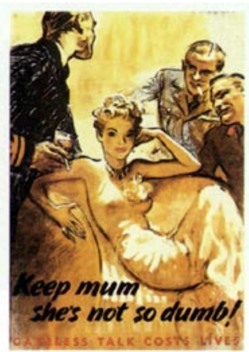
ප්‍රතිවිරුද්ධ පැත්තේ හා මෙහි, 120-123, යුධ සමයේ බ්‍රිතාන්‍ය පෝස්ටර්

මේ සියළු හිතකාවන් සැබෑ කරමින් ජපානය ශ්‍රී ලංකා වෙත ප්‍රහාර එල්ල කරන විට ඒ පිළිබඳව තොරතුරු ඊට ප්‍රථම කොළඹට ලගා වී තිබිණ. ආරක්‍ෂක සංචාරවල යෙදෙමින් සිටි බ්‍රිතාන්‍ය ගුවන් නියමුවකුට දෙවුන්දුරට ගිණිකොන දෙසින් ශ්‍රී ලංකාව වෙත ලගා වෙන ජපන් නාවික බල ඇණියක් දක්නට ලැබිණ. ඔහු පියාසර කල ගුවන්යානය, ජපනුන් විසින් වෙඩි තබා බිම හෙලන්නට කලින් එම පණිවිඩය ගුවන් විදුලි තරංග දිගේ වූ මූලස්ථානය කරා එවන්නට ඔහු සමත් විය. ඔලිවර් ගුණතිලක සටහන් කර තිබූ අන්දමට අපේ දිවයිනට ආරක්‍ෂාවක් නොපැවතියේය. ඔහු තවදුරටත් පවසන්නේ අපට තිබූ හමුදා සම්පත් ආක්‍රමණයකට මුහුණ දීමට කිසිසේත්ම නොසෑහුණු බවයි (Jeffries, 1958, p.58).