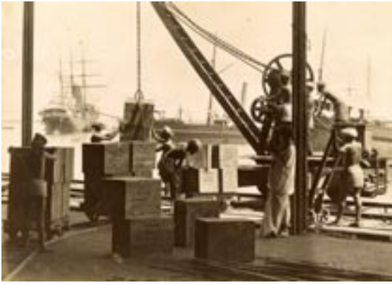
119. තේ බහාලුම් නැව්ගත කිරීමට සූදානම් කෙරේ

පෙර පෞද්ගලිකරණය කෙරුණද එම්.ඩී. ලේඛලය යටතේ අලෙවි වන භාණ්ඩ අදත් වෙළඳ පොළේ දක්නට ලැබේ. ආණ්ඩුව විසින් ස්ථාපනය කරන ලද ප්‍රථම කම්හල පවත්වාගෙන යාමේ කටයුතු වලට සම්බන්ධව සිටියදී සහ රජයේ කම්හල් වල නිෂ්පාදන අලෙවි කිරීමේ අංශය සංවිධානය කිරීම භාරව සිටියදී එන්. යූ. හොඳින් වටහාගත් තවත් කරුණක් විය. එනම් රජය විසින් කර්මාන්ත පවත්වාගෙන යාම අයෝග්‍ය බවයි. දේශපාලන ඇඟිලි ගැසීම් වල සිට අත්දැකීම් වලින් සහ ප්‍රායෝගික දැනුමින් තොර රාජ්‍ය සේවයකයින්ගේ වැරදි තීරණ ගැනීම් දක්වා කරුණු මේ කර්මාන්ත වලට අහිතකර ලෙස බලපානු එන්. යූ. හොඳින් අත්දැකීමකි. ව්‍යාපාර වලට රජයේ මැදිහත්වීම තරයේ පිටුදකින්නට පසු කාලීනව පෙළඹවූයේ ඔහුගේ මේ අත්දැකීම්ය.