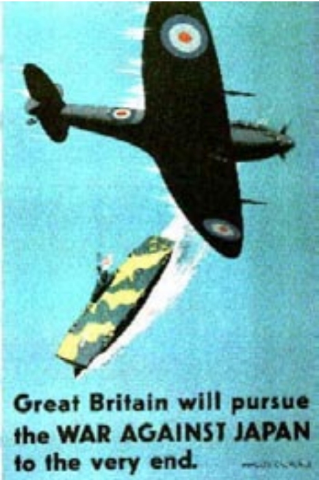
125. යුධ සමයේ බ්‍රිතාන්‍ය පෝස්ටරයක්.

1942 අප්‍රේල් 5 වන දා පාස්කු ඉරිදා ජපන් හමුදාම ශ්‍රී ලංකාවට ප්‍රහාර එල්ල කිරීම ආරම්භ කළේය. ජපන් ගුවන් යානාවල ඉලක්කය වූයේ කොළඹ වරාය සහ රත්මලාන ගුවන් තොටුපලයි. ඔවුන්ගේ ඊළඟ ඉලක්කය වූයේ ත්‍රිකුණාමලය වරායයි. කෙසේ වුවද ප්‍රහාර දෙකෙන්ම විනාශයට පත්වූයේ නැව් කිහිපයක් පමණකි. මිය ගිය සාමාන්‍ය ජනතාවගේ සංඛ්‍යාව ද ඉතා අවම විය. කොළඹට එල්ල කල ප්‍රහාරය පැවතුනේ ඉතා කෙටි කාලයක් වුවද ඉතා දැඩි එකක් විය. රැයක් එලිවන විට කොළඹ ජන ශූන්‍ය නගරයක් බවට පත්විය. එහිදී ඇතිවූ තත්වය පෙහිනිස් විස්තර කරන්නේ මෙසේය.