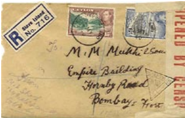
124. රජයේ වාරණය අනුව විවෘත කරන ලද ලිපියක්.

දෙවන ලෝක සංග්‍රාම සමයේ කුඩා දැරියකව සිටි එන්. යූ. ගේ දියණිය නිලියා ගේ මනකයේ ගුවන් ප්‍රහාරයන් හොඳින් රැඳී තිබේ.