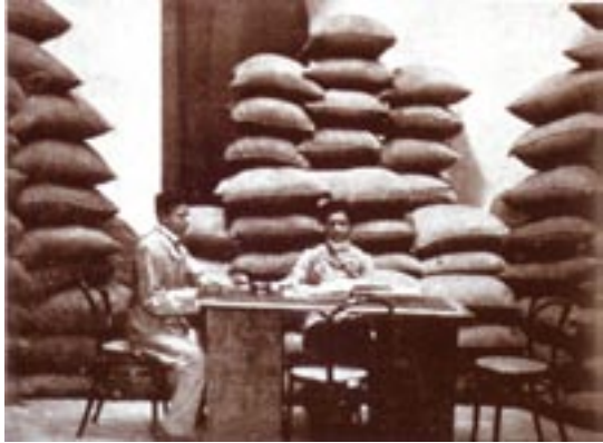
127. කොටුවේ තොග වෙළඳුන්.

“ඇල දොල වල බැස මාලු ඇල්ලීම ද, වසු පැටවුන් සමඟ සෙල්ලම් කිරීම ද අනෙක් ළමයින් සමඟ එක්ව ක්‍රීඩා කිරීමට ද අතිශයින් ප්‍රීති ජනක බව අප වටහා ගත්තේ කොස්කඳුවල ගත කල මෙම කාලය තුලදී ය. අම්මා අපට බොහෝ සුන්දර දේ හඳුන්වා දුන්නාය. අපේ මුළු ජීවිතය ද සියලු ක්‍රියාකාරකම් ද ඇය වටා රැඳී තිබින (Neiliya Perera, 2006)